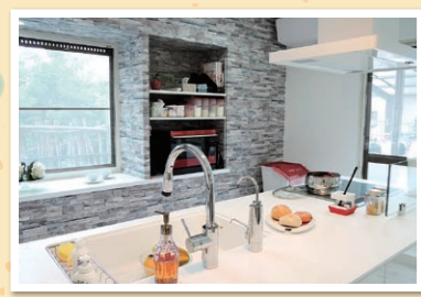
家電や調味料がすっきり片付く造作棚

憧れのアイランドキッチンにしたい! という奥様の強い要望から スタートした今回のリフォーム。床の張替えや間取りの変更をして、LDK全体が 統一感のある空間になりました。ご家族大満足のLDK全面リフォームです。