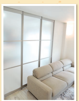
閉めればLDKの間仕切りに