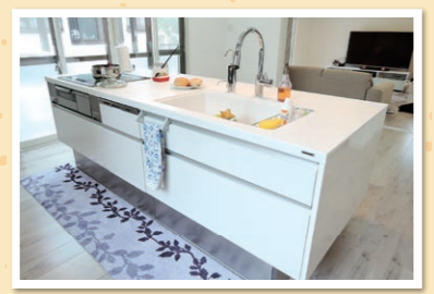
Panasonic アイランドフロートキッチン