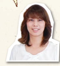
奥様サポーター 小島