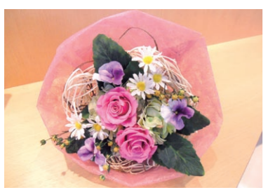
【アーティフィシャルフラワーとは】生花をリアルに再現し、生花にはない美しさを表現した造られた花です。年々クオリティも向上、生花では出せない高い芸術性と耐久性で、世界的に高い評価を受けています。