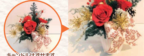
キャンドルははずせます。