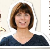
奥様サポーター 小島

ガスコンロもIHクッキングヒーターも、「自動炊飯モード」を使うと便利♪もちろん、炊飯器でも美味しくできあがります。